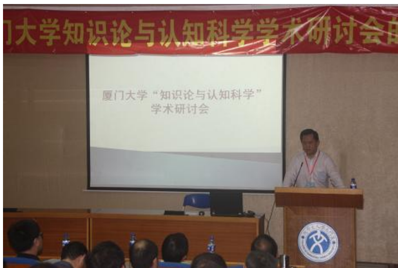
图为中国现代外国哲学学会会长江怡教授致辞

知识论中心坚持对内举办长期规律性的学术活动以激活团队成员科研活力，保持对外竞争实力，对外则争办有影响力的重大学术会议，向学术界推介知识论中心年轻学者，实现中心团队的有序发展和奠定持续影响基础。